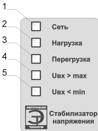
Рис.1 Лицевая панель стабилизатора.

заземляющим контактом для подключения нагрузки мощностью до 2 кВА и клеммная колодка для подключения стабилизатора к сети и нагрузке.